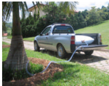
Em uso na irrigação.