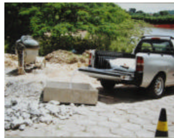
Em uso na construção civil.